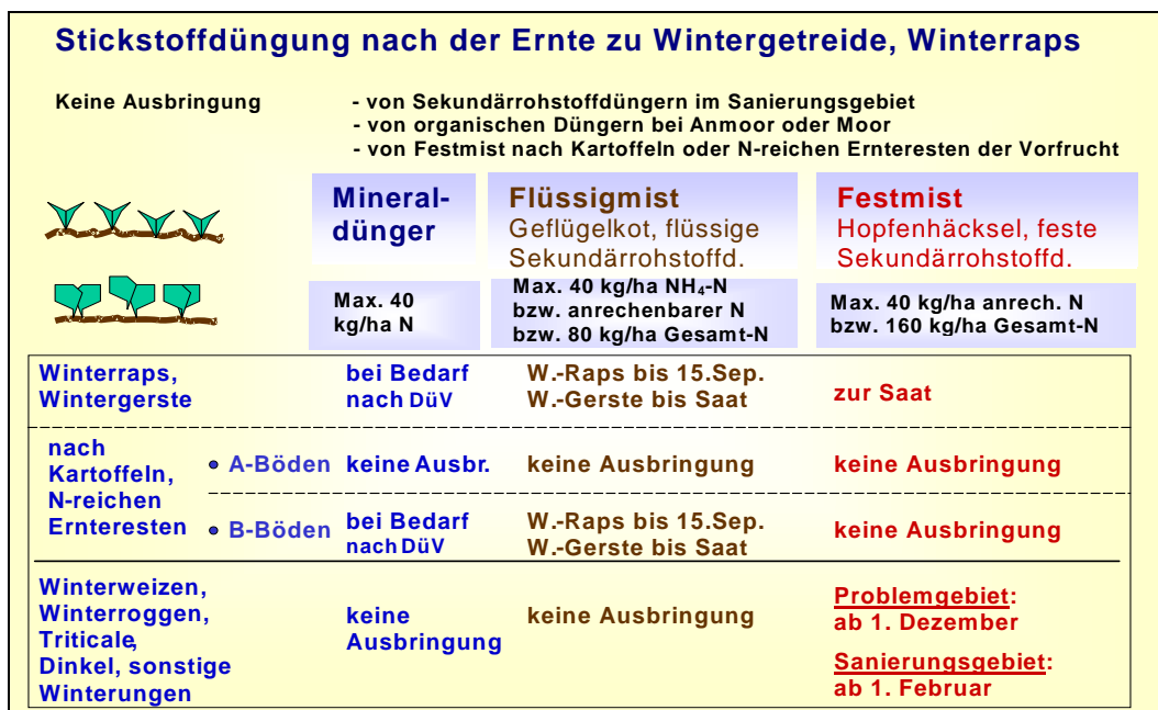
Abb. 6: Stickstoffdüngung nach der Ernte in Problem- und Sanierungsgebieten zu Wintergetreide und Winterrraps

Durch die Schutzbestimmungen sind evtl. Anpassungen nötig. Die Lagerkapazität ist ggf. auszudehnen, die Lagermöglichkeit anderer Betriebe oder von Gemeinschaftsbehältern ist auszunutzen, flüssiger Wirtschaftsdünger muss ggf. abgegeben werden.