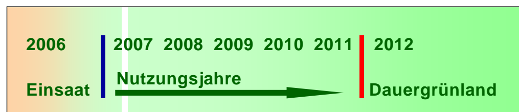
Abb. 3: Beispiel zur Definition von Dauergrünland