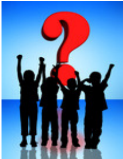
Offerta: KISTE - Assistenza per i bambini con genitori malati psicologicamente e tossicodipendenti, ed esperienza con violenza in collaborazione con l'agenzia tedesca protezione dell'infanzia.