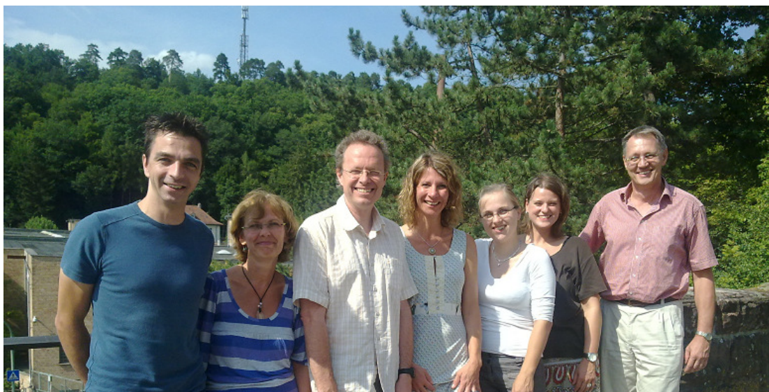
Gli psicologi del Centro di consulenza