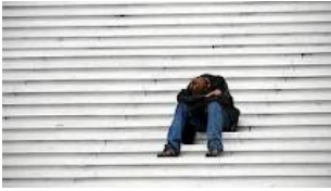
Crisi di vita