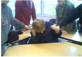
Bullismo, esclusione sociale