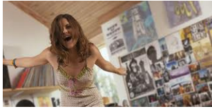
Crisi di pubertá e sostituzione